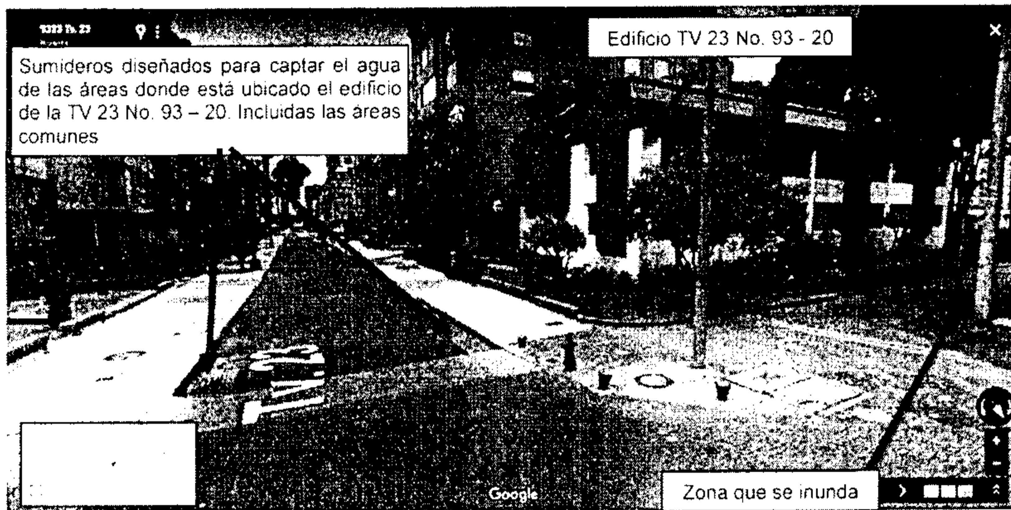
Imagen No. 4.