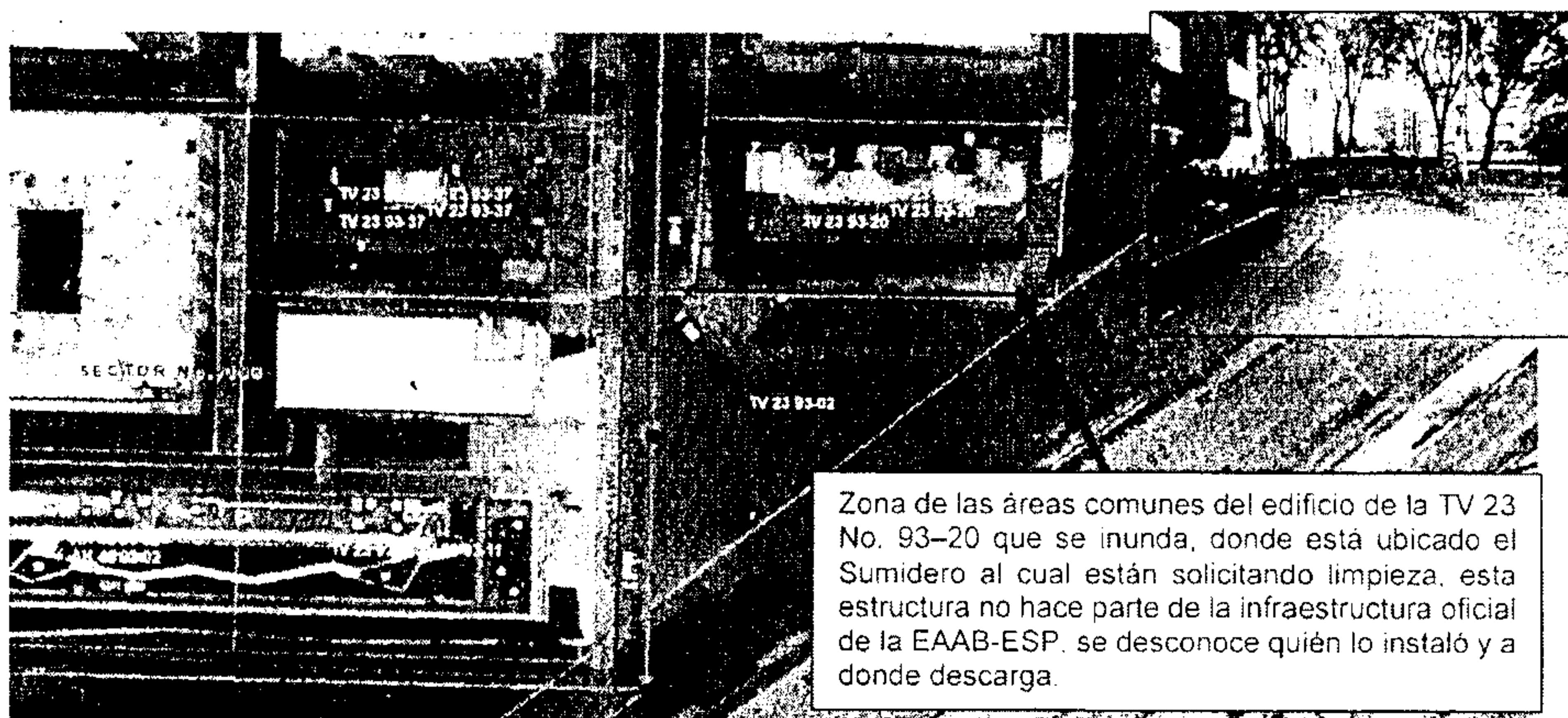
Imagen No. 1.

• Imagen No. 1: Localización del predio conforme al Sistema de Información Geográfico Unificado Empresarial (SIGUE) de la EAAB-ESP, con información de redes oficiales de acueducto, alcantarillado sanitario y pluvial, así como la localización de la zona de las áreas comunes del edificio que se inunda, donde existe un sumidero artesanal que no fue construido por la EAAB ESP y que no es de nuestra responsabilidad.