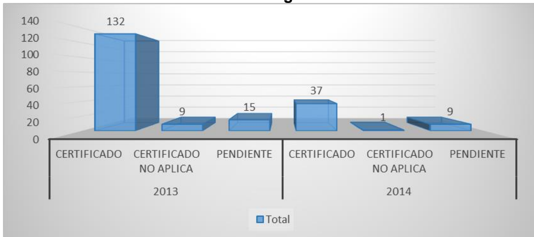
Gráfico 2. Estado de cargue al SUI 2013-2014