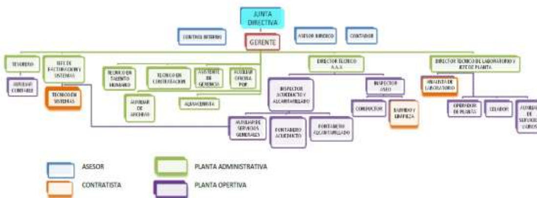
Ilustración 1. Organigrama