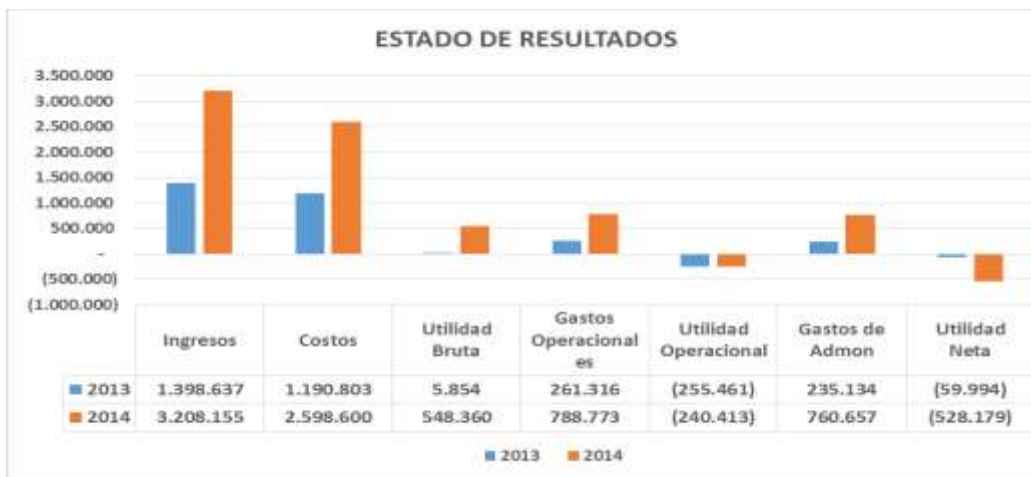
Grafica 1. Estado de Resultados Comparativo 2013 – 2014 (Cifra en Miles de Pesos)

Se observó un descenso del 69.7% en la cuenta Otros Ingresos, correspondientes a ingresos financieros y extraordinarios para el año 2014, pasando de $201 millón a $61 millón para los años 2013 y 2014.