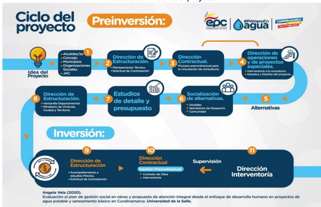
Ilustración 2. Ciclo del proyecto