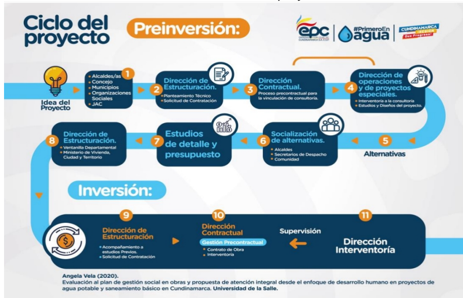
Ilustración 2. Ciclo del proyecto

Fuente: radicado No. 20225291733482 del 3 de mayo de 2022