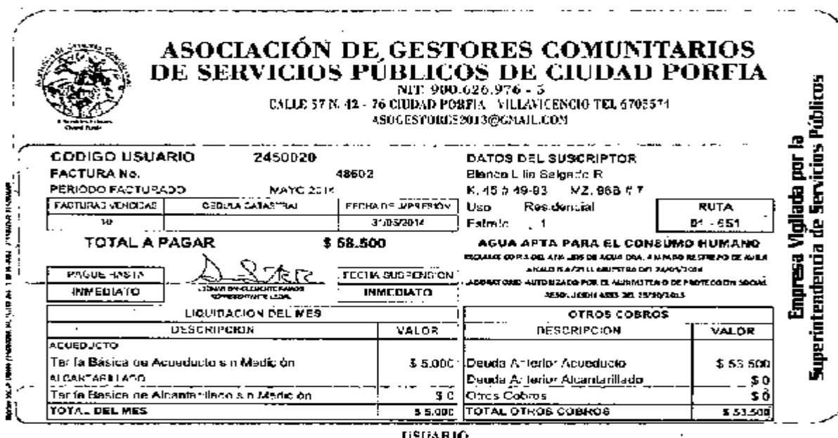
Imagen No. 2 Factura

Empresa Vigilada por la Superintendencia de Servicios Públicos