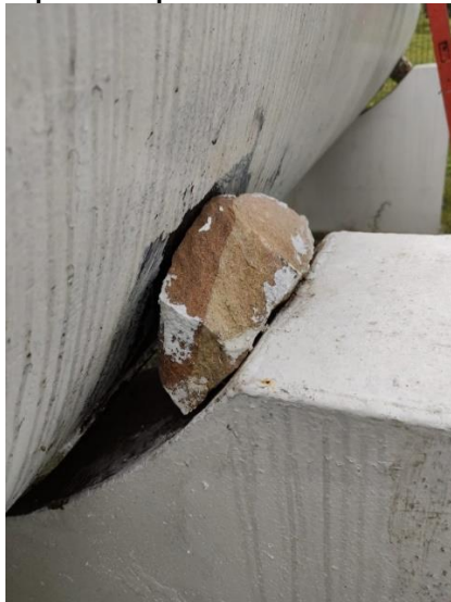
Imagen 5. Obra civil que soporta tanque estacionario DISTICON SAS ESP - Gachantivá