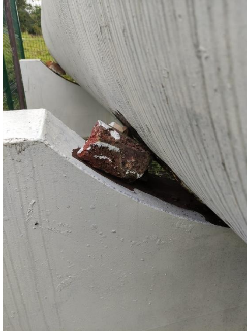
Imagen 6: Obra civil que soporta tanque estacionario DISTICON SAS ESP - Gachantivá