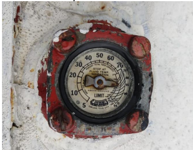
Imagen 7 medidor de nivel de Tanque Estacionario DISTICON SAS ESP – Gachantivá