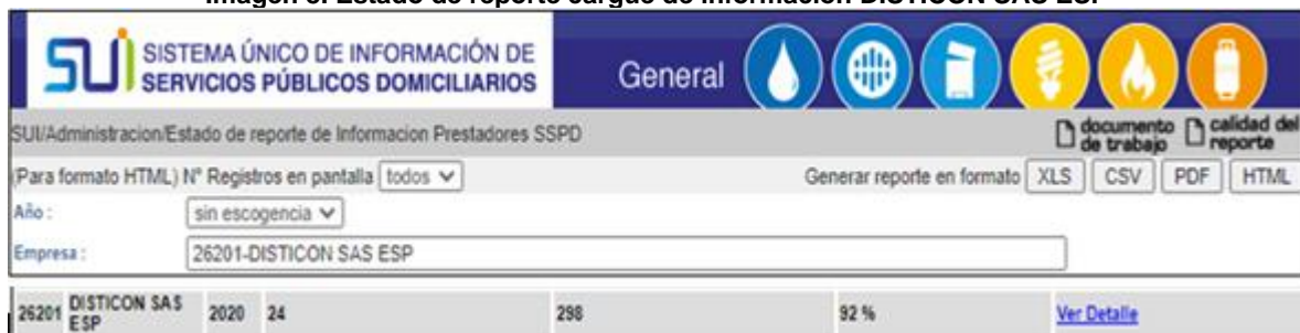
Imagen 8. Estado de reporte cargue de información DISTICON SAS ESP