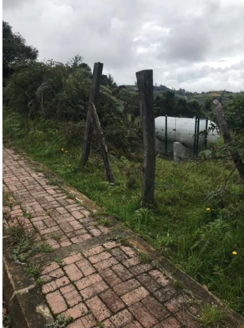
Imagen 1. Tanque de almacenamiento DISTICON SAS ESP - Gachantivá