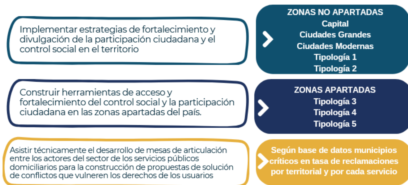
Figura 3. Relación plan de acción y selección municipios

En este orden de ideas, se estableció para el cumplimiento de metas de acuerdo con las actividades de plan de acción 2024 se realice tomando en cuenta la metodología de identificación de tipologías municipales así (Ver Anexo 12.):