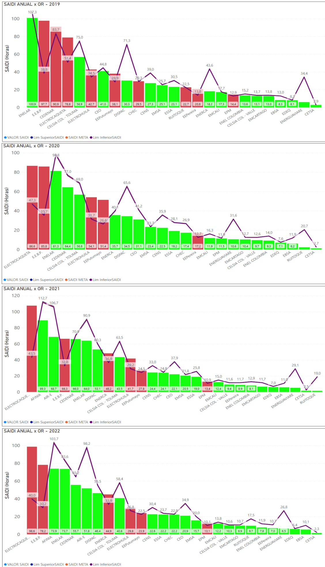
Figura 1. Comportamiento del Indicador SAIDI, 2019 – 2023