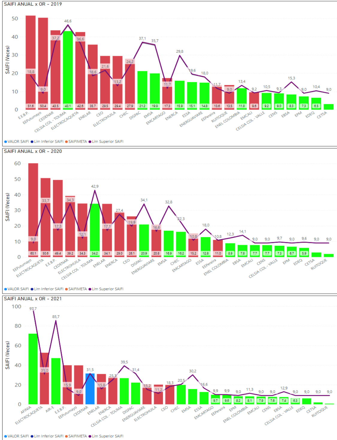
Figura 2. Comportamiento del Indicador SAIFI, 2019 – 2023